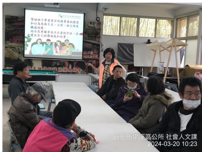
圖片 7 說明：性別意識培力課程