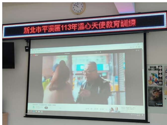
圖片 11 說明：失智守護天使課程