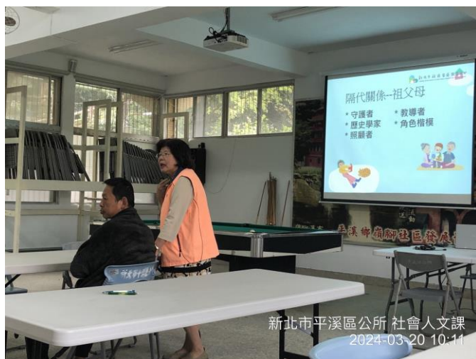
圖片 8 說明：性別意識培力課程