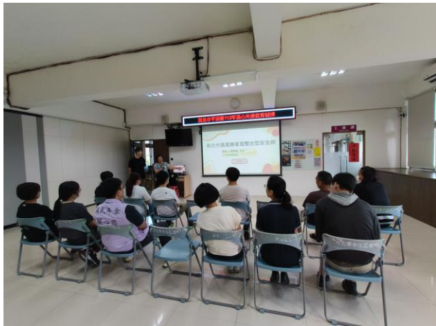
圖片 1 說明：全齡高風險