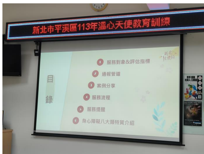
圖片 9 說明：身心障礙家庭關懷