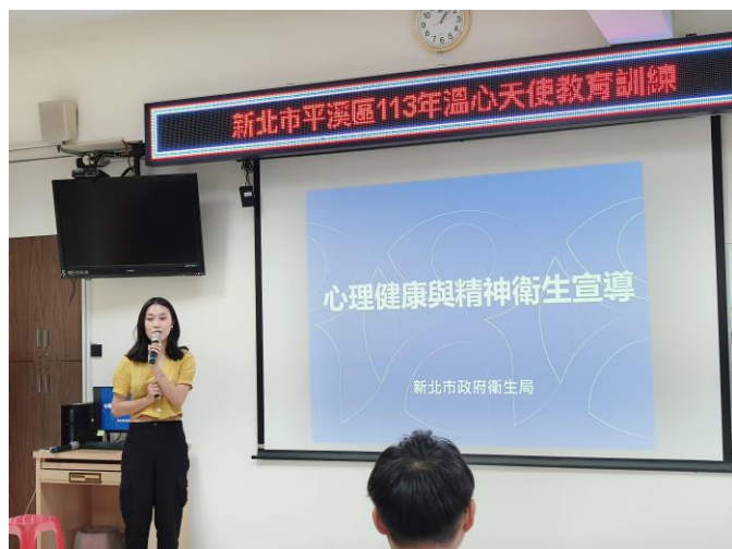
圖片 5 說明：心理健康與精神衛生宣導