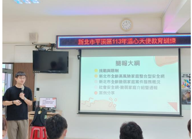
圖片 2 說明：全齡高風險