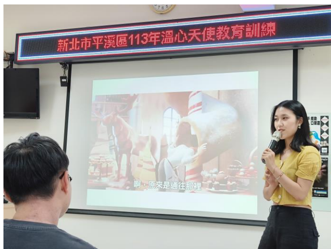
圖片 6 說明：心理健康與精神衛生宣導