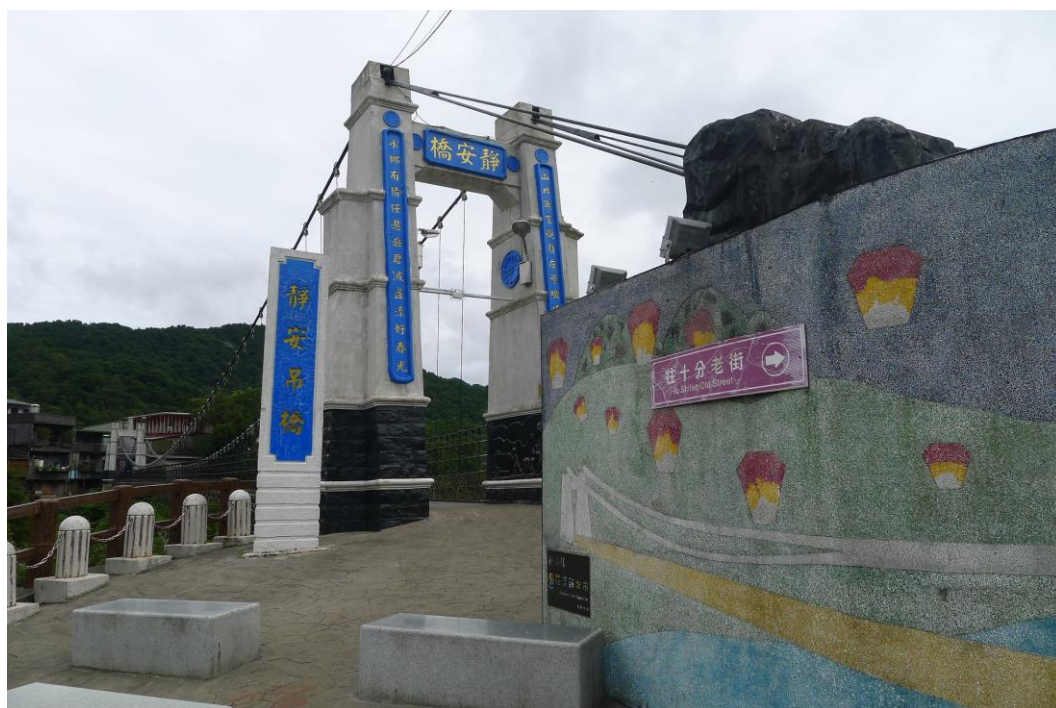
圖五 新北市平溪區靜安吊橋風景區