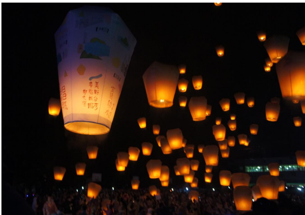
圖四 新北市平溪區天燈節施放情形