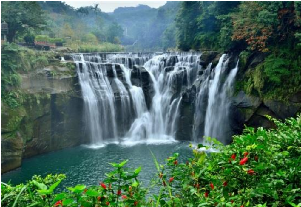
圖三 新北市平溪區十分瀑布風景區

以「天無三日晴，地無三里平」來形容本區，是再適合不過的了，但本區所擁有的溪流、瀑布群、壺穴、以及極富野趣的山林，還有充滿著懷舊情感的平溪線鐵路，和沒落煤礦社區的人文氣氛所感染的鄉愁，取其無用之用，也因此讓本區有足夠的資源發展觀光事業，並藉「平溪一日遊」的活動推而廣之。平溪放天燈的習俗至今已有百年歷史，與台南市的鹽水蜂炮素有「南蜂炮北天燈」之喻，每年元宵節本區的區民都會放天燈向「天公伯仔」祈福消災，而這項獨特的民俗起源，原本是充滿了唐山過台灣的移民心酸血淚，不過隨著時空的移轉，放天燈活動的意義也不同了，充份反應出台灣民俗文化的活潑及多樣性。