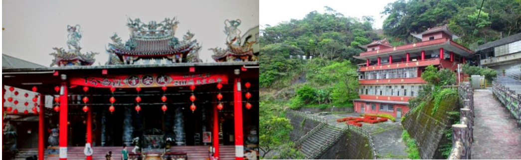
圖二 新北市平溪區廟宇

同於西方，中國宗教堪稱是「人文宗教」，有著文化與教育的功能。是以，宗教在人民日常生活占有重要的地位。